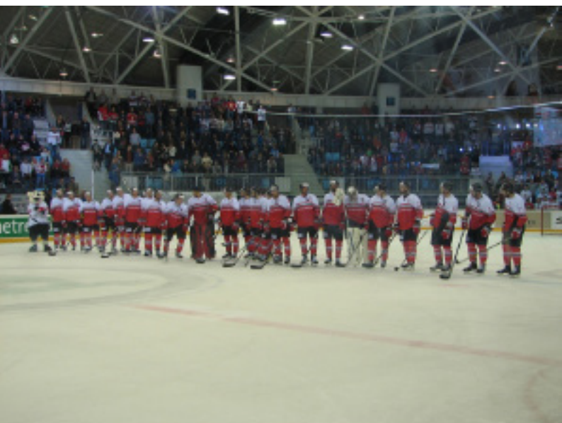
A magyar válogatott ezzel hangolt az A csoportos VB-re