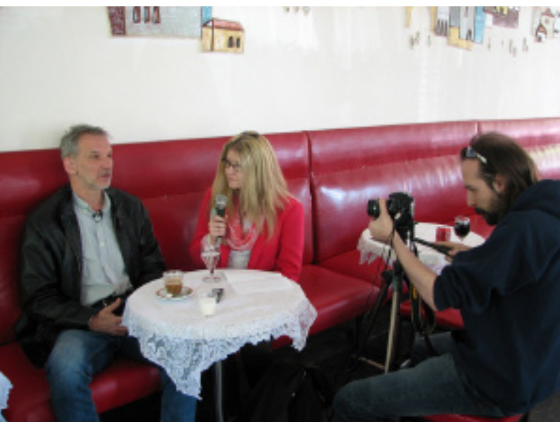
László Zsolt színművésszel készítettünk interjút