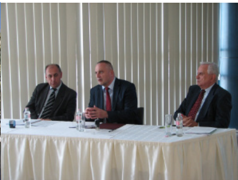
Erősíti egészségügyi képzését a Széchenyi István Egyetem