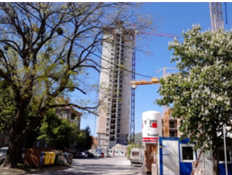
Elkezdődött a pécsi magasház bontása