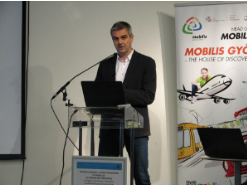
Sharing Economy Konferencia