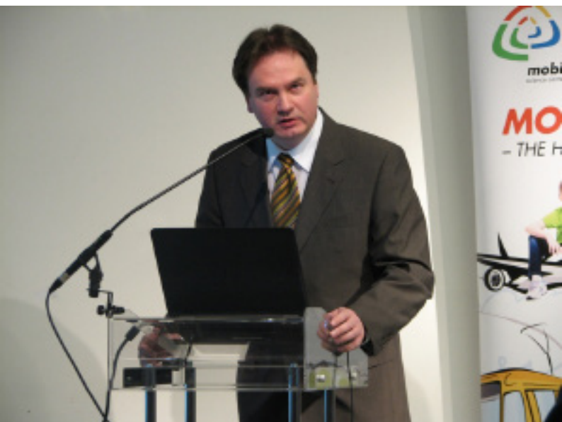
Sharing Economy Konferencia