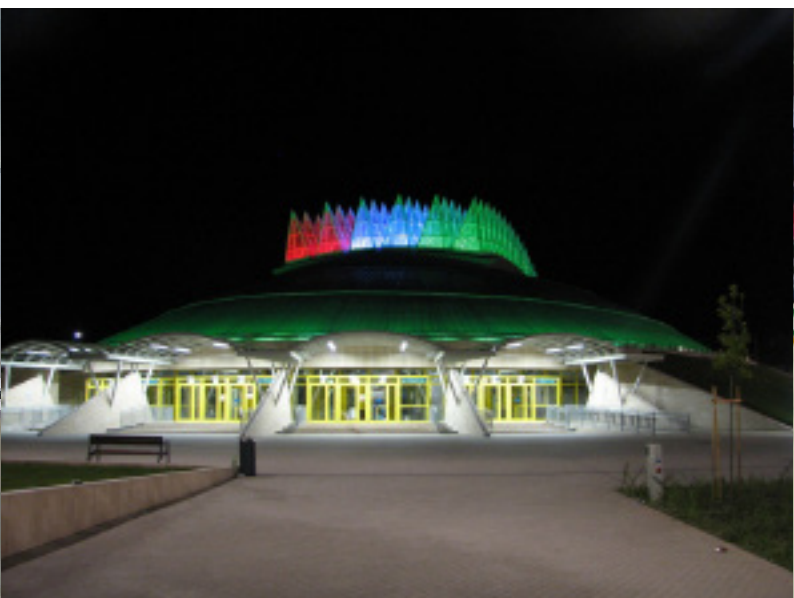
A Tüskecsarnokban zajlott a Hokimaraton