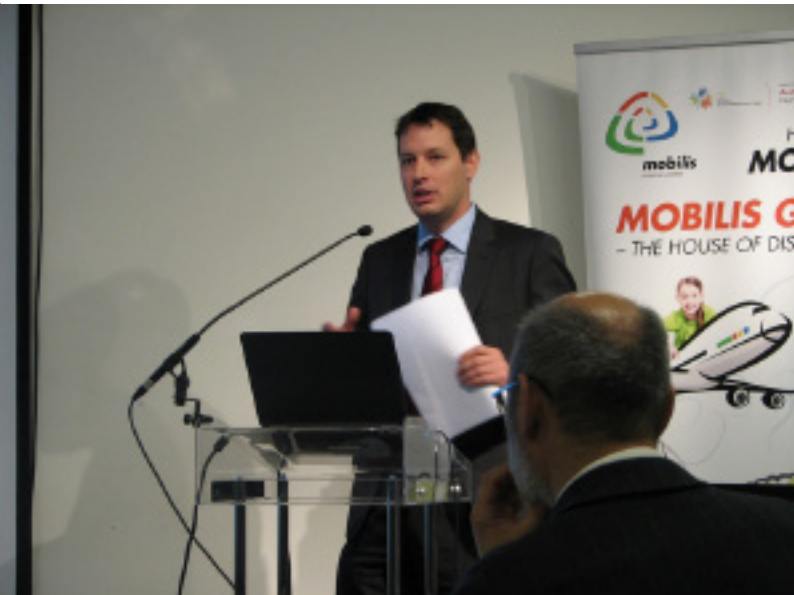
Sharing Economy Konferencia