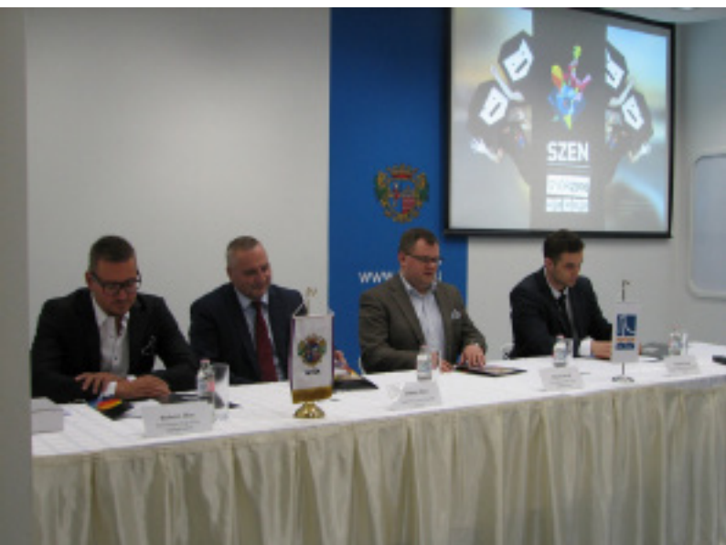
SZEN sajtótájékoztató Győrben