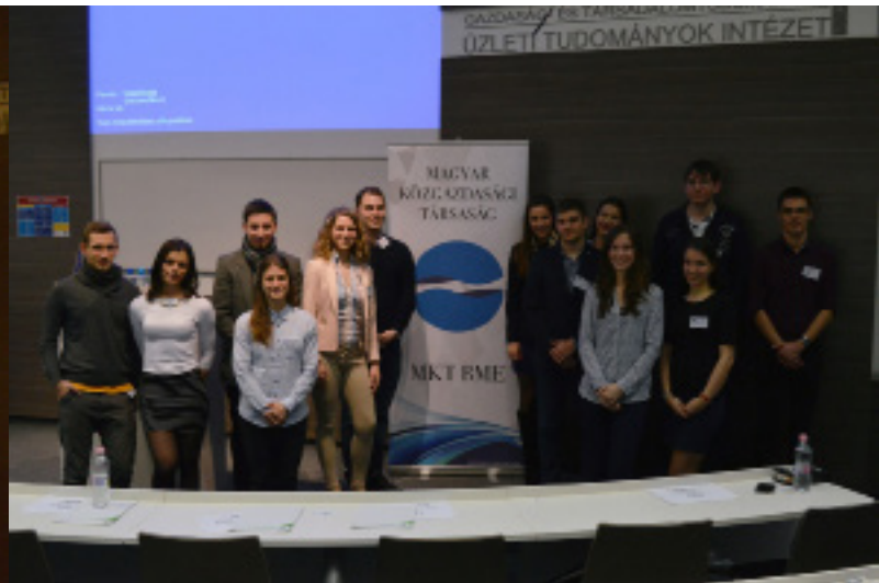
A Business and Technology szervezői, az MKT BME