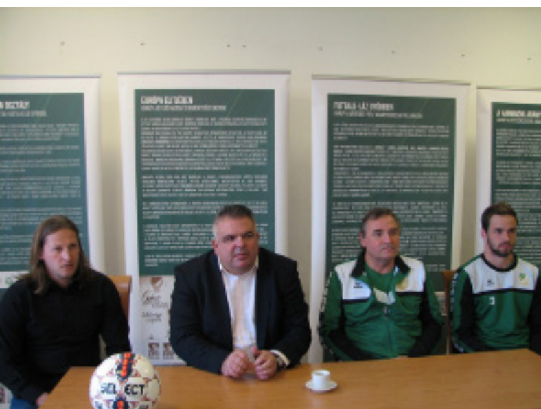
Az ETO FC Győr célja továbbra is a feljutás