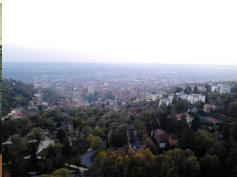
Pécs lesz az idei FIKOT házigazdája