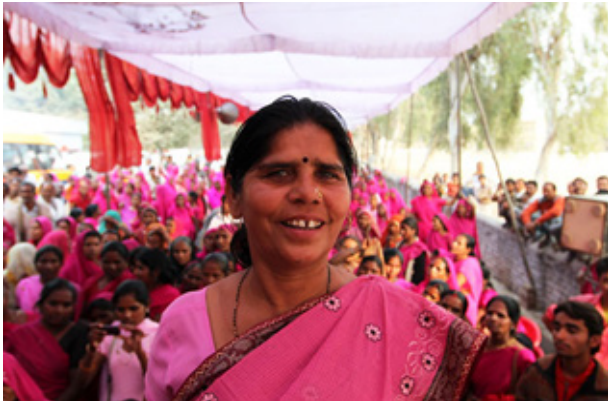
A képen Sampat Pal, a Gulabi Gang alapítója