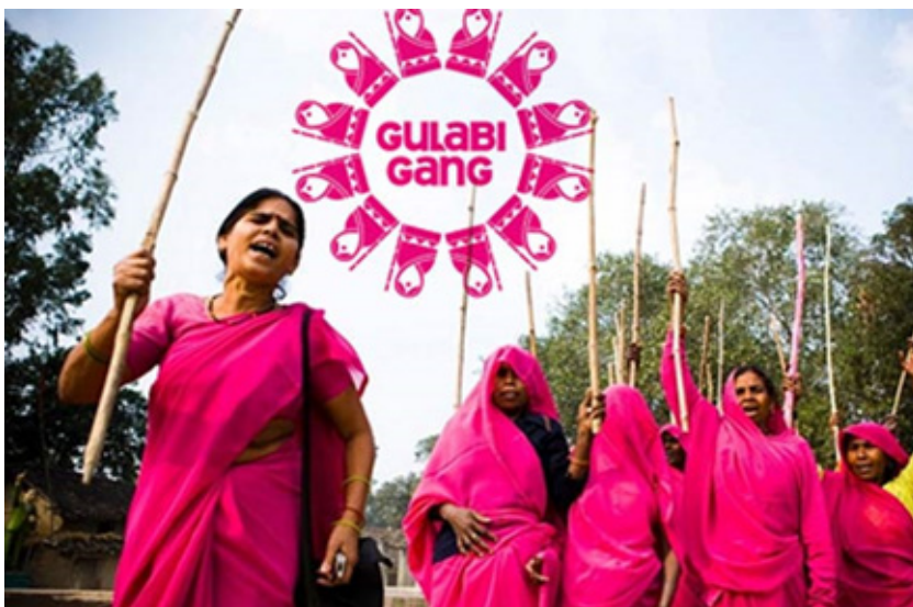
ANéhány tag a Gulabi Gang-ból