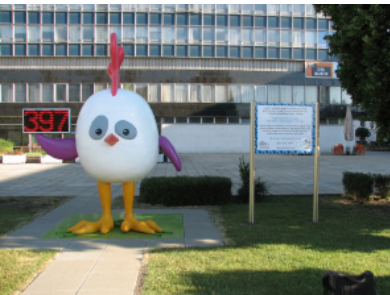
Hugoo, a 2017-es győri EYOF kabalája visszaszámol