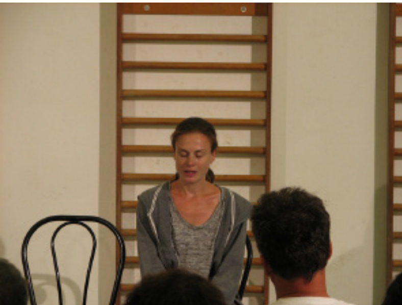
A Thália Színház „Soha senkinek” című darabja