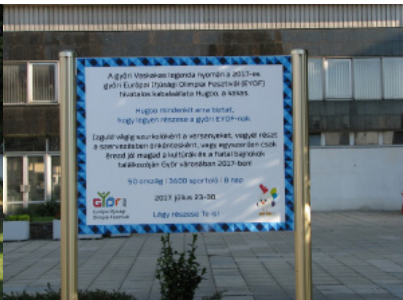
Az EYOF-ot népszerűsítő plakát Győrben