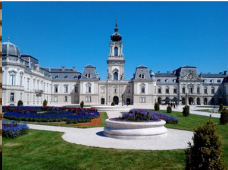
Keszthelyen volt a DOSZ Nyári tábora