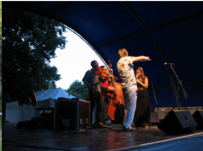
Koncert az Ördögkatlanon