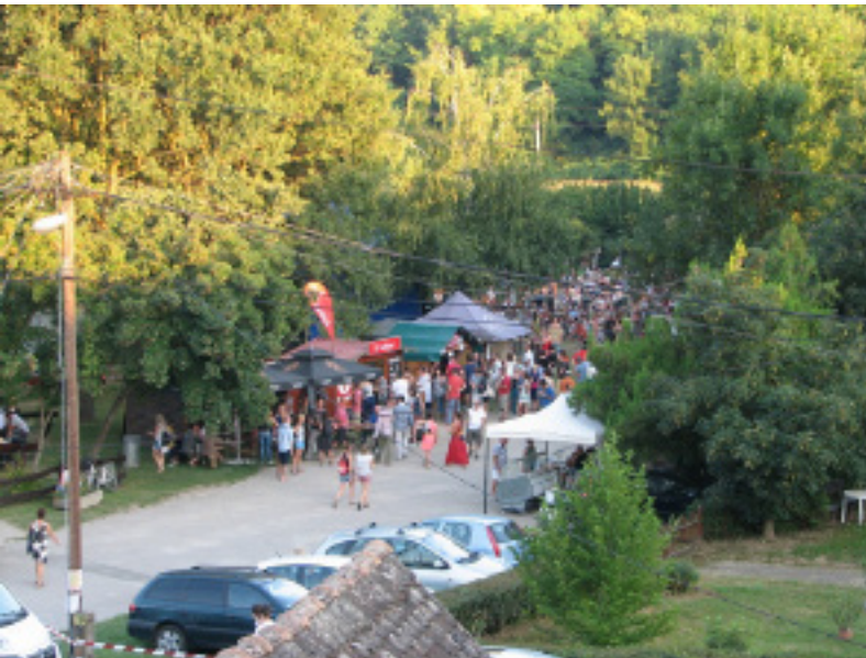
Idén is sokan voltak az Ördögkatlan Fesztiválon