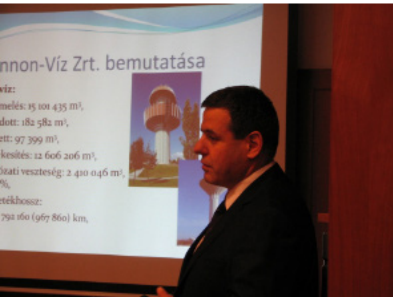
A Pannon Víz volt MUT Smart City előadásának vendége