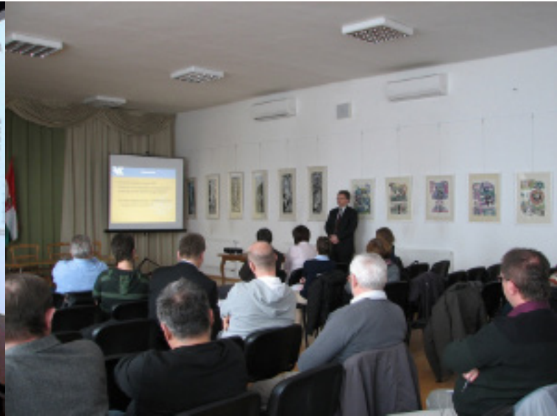
Városfejlesztési workshop Zircen